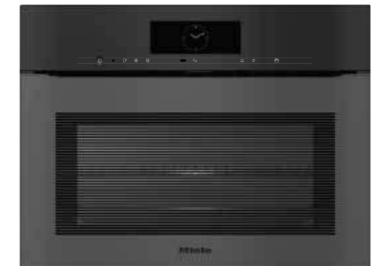
H 7840 BMX ArtLine