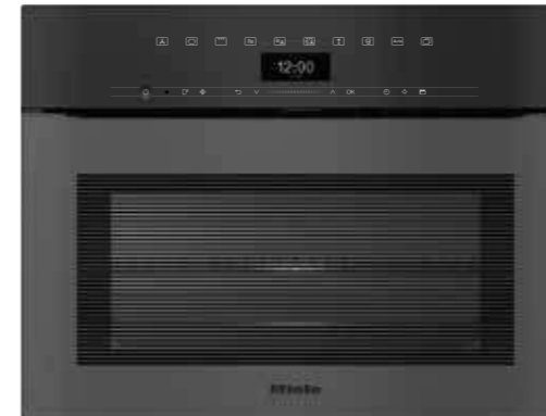
H 7440 BMX ArtLine