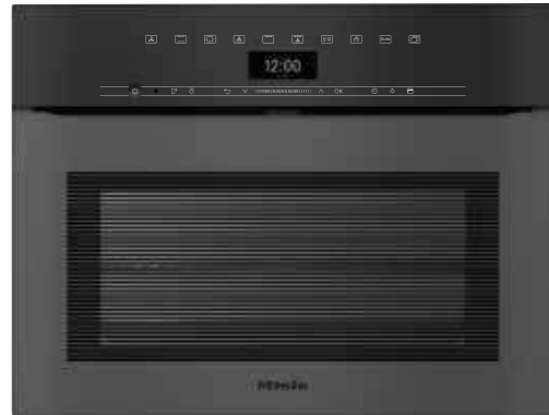
H 7440 BPX ArtLine