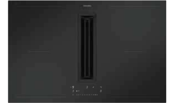
KMDA 7876 FL-U 125 Gala Ed (80 cm)