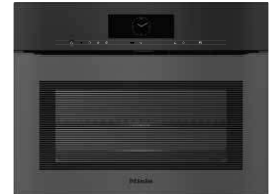
DGC 7840 HCX Pro ArtLine