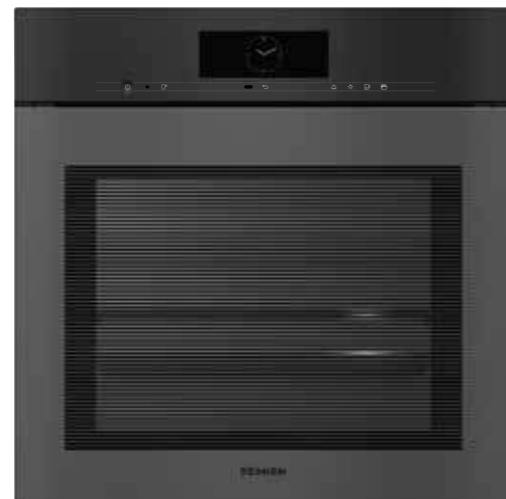
DGC 7860 HCX Pro ArtLine