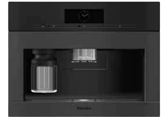
CVA 7845 ArtLine