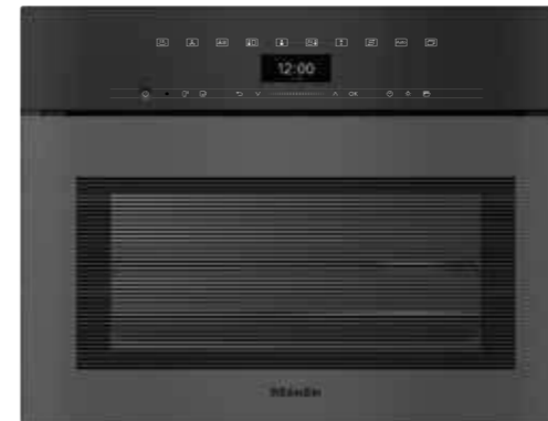
DGC 7440 HCX Pro ArtLine