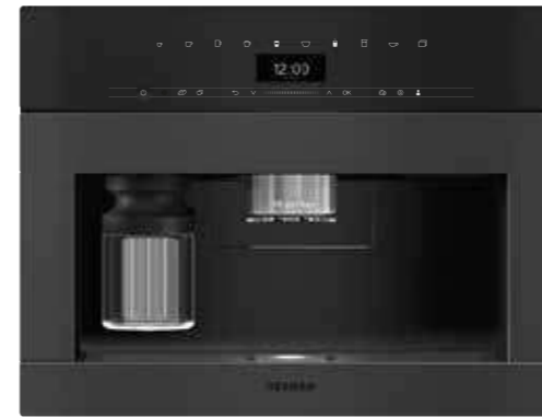
CVA 7440 ArtLine