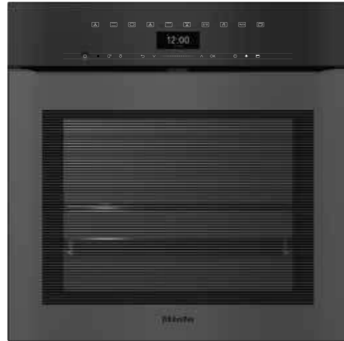
H 7464 BPX ArtLine