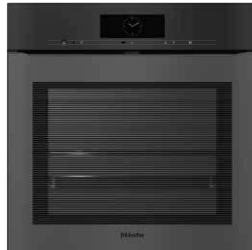
H 7860 BPX ArtLine