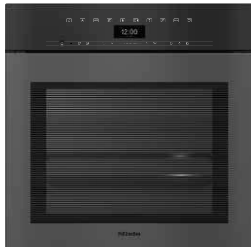
DGC 7460 HCX Pro ArtLine