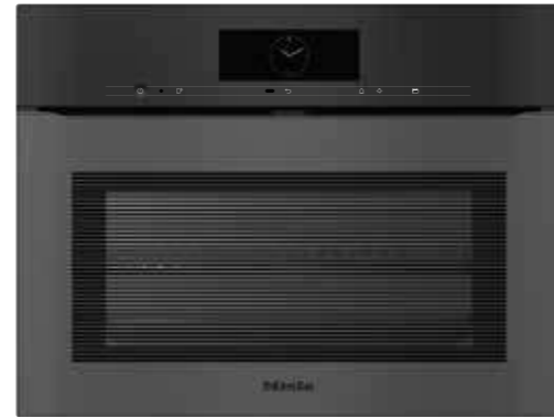
H 7840 BPX ArtLine