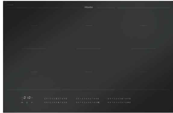
KM 7576 FL 125 Gala Ed (80 cm)